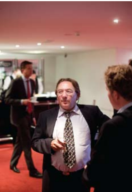
▲ Bijpraten in de wandelgangen.